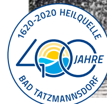
"Tempel der Genesung" Hauptbrunnen errichtet 1795